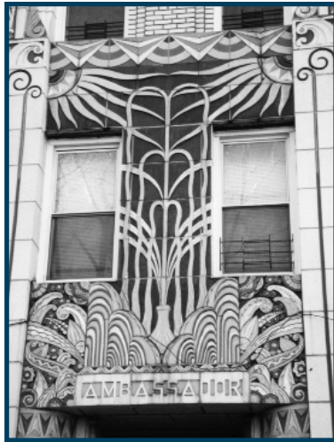
Ambassador Apartments, Staten Island

Una servidumbre de preservación histórica es un acuerdo legal para proteger a perpetuidad el exterior histórico