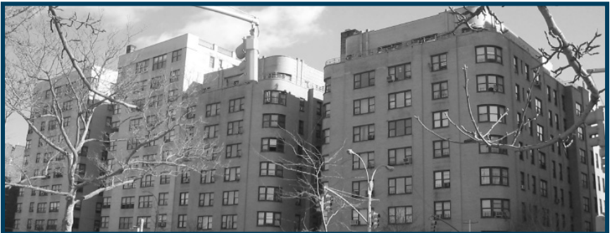
Grand Concourse, The Bronx

Puede encontrar más información sobre las donaciones de servidumbre aquí savingplaces.org . Para encontrar organizaciones calificadas que acepten servidumbres, comuníquese con la Oficina Regional del Noreste del National Trust for Historic Preservation al (202) 588-6000 o info@savingplaces.org . O bien, puede comunicarse con la Oficina de Preservación Histórica del Estado de Nueva York al (518) 268-2171.